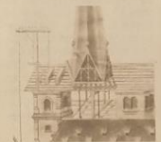
Der Plan zur Priener Turmverschiebung.